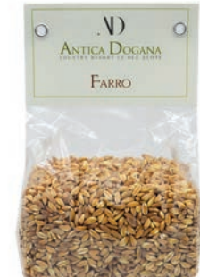
Farro di Maremma gr 300 € 4,00