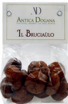
Il Bruciaùlo gr 150 € 4,00