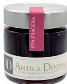
Uva Fragola gr 250 € 6,00