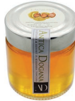
Miele di Castagno gr 150 € 5,00