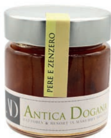
Pere e Zenzero Fresco gr 250 € 6,50