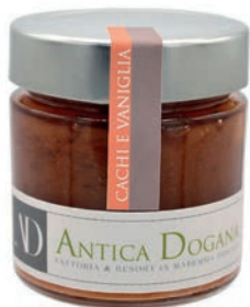
Cachi e Vaniglia gr 250 € 6,00