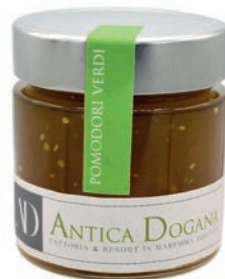
Pomodori Verdi gr 250 € 6,50