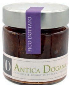
Fico Dottato gr 250 € 6,00