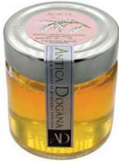
Miele di Acacia gr 150 € 5,00