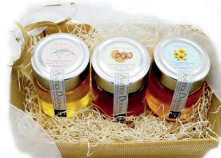
Confezione regalo con 3 mieli assortiti da gr 150 € 14,50