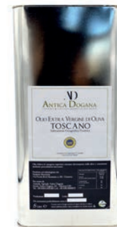
Lattina da 5 lt € 79,00