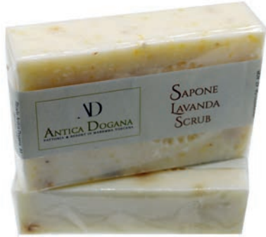
Lavanda e Crusca effetto Scrub € 4,50