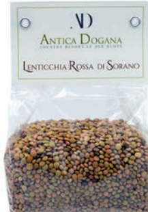
Lenticchia Rossa di Sorano gr 300 € 4,00