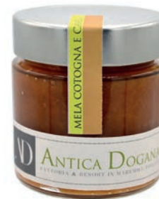
Mela Cotogna e Cannella gr 250 € 6,00