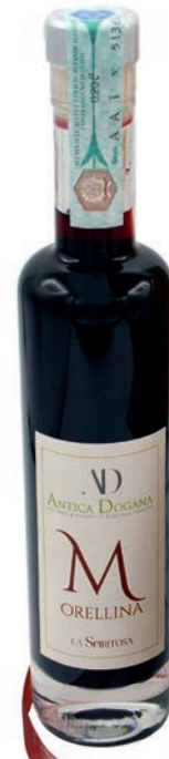
Morellina in versione Regalo ml 200 € 16,00