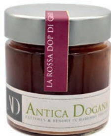
Cipolla Rossa DOP di Grosseto gr 250 € 6,50