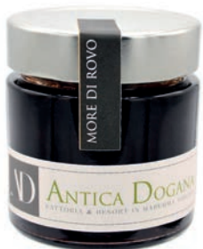
More di Rovò gr 250 € 6,00