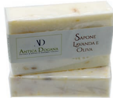
Lavanda e Olio EVO € 4,50