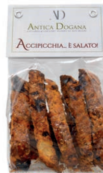
Accipicchia... è salato! gr 150 € 5,00