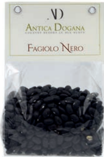
Fagiolo Nero gr 300 € 4,00