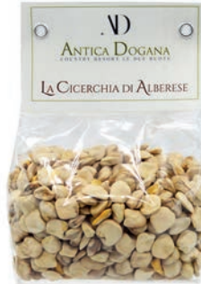
Cicerchia di Alberese gr 300 € 4,00