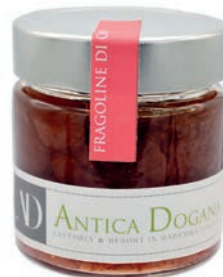
Fragoline di Campo gr 250 € 6,00