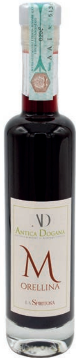
Morellina con Vino e Ciliegie ml 200 € 14,00