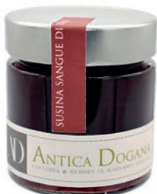
Susina Sangue di Drago gr 250 € 6,00