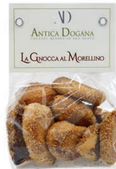
Gnocca al Morellino gr 150 € 4,50