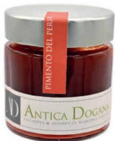
Peperoni e Peperoncino Piccante gr 250 € 6,50