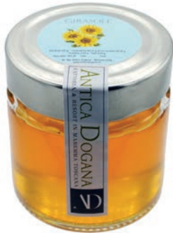
Miele di Girasole gr 150 € 5,00