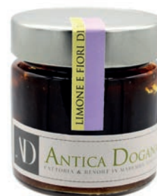
Limone e Fiori di Rosmarino gr 250 € 6,50