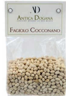
Fagiolo Cocconano gr 300 € 4,00