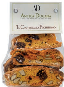
Cantuccio Fichissimo gr 150 € 5,50