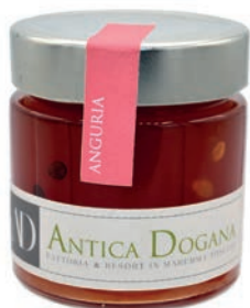
Anguria gr 250 € 6,50