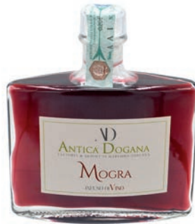
Mogra con Vino e Grappa ml 200 € 19,00