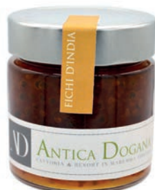
Fichi d'India gr 250 € 6,50