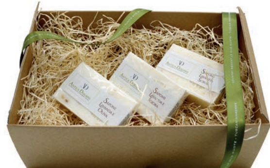
Confezione Regalo 3 saponi naturali assortiti € 15,00