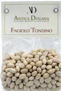
Fagiolo Tondino gr 300 € 4,00