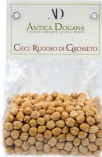
Cece Rugoso di Grosseto gr 300 € 4,00