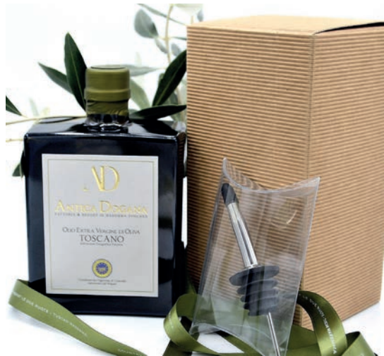
Limited Edition 0.50 lt. € 20,00