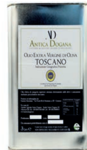
Lattina da 3 lt € 54,00