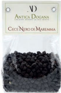
Cece Nero di Maremma gr 300 € 4,00