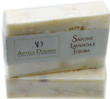
Olio EVO e Jojoba € 4,50